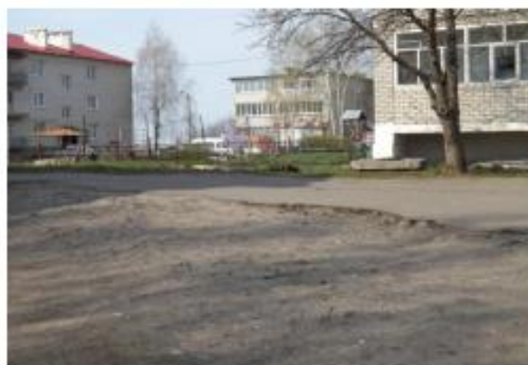
Видение к детскому саду