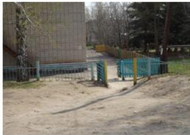
Вход на территорию детского сада