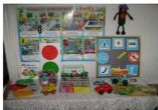
Уголок БДД + Стенд безопасного мажарута